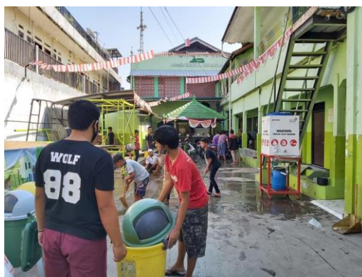
Gambar 3. Media Visual Implementasi Living Hadith .

Berdasarkan hasil validasi ahli, media pembelajaran direvisi dengan menambahkan media visual berupa gambar cetak untuk membantu peserta didik memahami implementasi nilai-nilai hadits tentang tanggung jawab kepemimpinan secara lebih konkret. Adapun contoh media yang digunakan sebagai berikut: