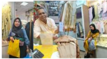
Gambar 2.5 Konsumen Alfabe Clothing