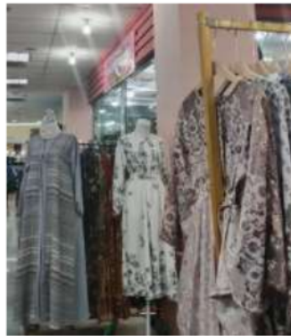
Gambar 2.6 Pesaing Pakaian Muslimah Toko Alfabe Clothing

Berdasarkan hasil dari data Toko Alfabe Clothing, pertimbangan pengusaha ini terhadap pesaing, disebabkan banyaknya para pesaing yang ada pada industri pakaian yang mempunyai harga kompetitif, jadi tidak kaget jika pengusaha Alfabe Clothing di Surabaya memandang penting soal jumlah pesaing yang ada di dekat toko ini (Setyowati., 2015).