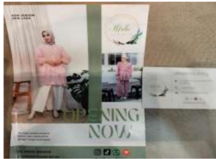
Gambar 2.1 Brosur dan Kartu Nama Alfabe Clothing

Dalam melaksanakan analisis internal pada aspek pemasaran, kebanyakan sebagian perusahaan bisnis memakai konsep bauran pemasaran (marketing mix) pemasaran. Bauran Pemasaran merupakan kombinasi dari empat (4) variable yang menjadi inti dari sistem pemasaran organisasi perusahaan di Alfabe Clothing yaitu: Produk (Product) pakaian muslimah, Harga (Price) Rp.45.000 sampai Rp, 295.000, Tempat (Place) Mall ITC Surabaya, Promosi (Promotion) secara offline membagikan brosur dan kartu nama.