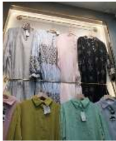
Gambar 2.4 Contoh Produk Dari Pemasok Tanah Abang

Berdasarkan hasil pengolahan data di toko Alfabe clothing, pertimbangan pengusaha ini terhadap pemasok, nyatanya kualitas produk pemasok yang dilihat dan dinilai paling utama. Hal ini disebabkan karena pengusaha lebih mengutamakan mutu kualitas produk. Apabila proses pengerjaan sebuah produk dilaksanakan dengan cara yang benar, maka kualitas barang bahan yang dipilih bagus akan menghasilkan barang yang baik. Toko Alfabe Clothing ini melakukan pembelian atau (grosiran) di pasar Tanah Abang Jakarta.