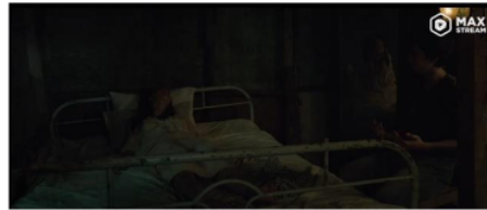
Gambar 18. Bahri meruqya ratna 0:29:19-30:32

Artinya: Cukup Allah yang menjadi penolong kami, karna Dia merupakan pelindung yang terbaik (QS. Al-Imran:173).