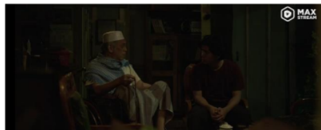
Gambar 3. Percakapan Abah dan Bahri 54:21-56:18

Pada scene ini menggambarkan tentang pesan akidah bahwa mati hidup seseorang telah di tentukan oleh sang pencipta, kita tidak memiliki kuasa atas hal ini dan itu merupakan takdir dari Allah dan takdir bisa berubah dengan doa yang bersungguh-sungguh.