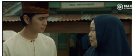
Gambar 12. Ketika bahri di usir oleh warga 1:05:29-1:05:38

Pada scene ini menggambarkan adanya pesan akhlak bahwa menolong sesama muslim merupakan akhlak yang terpuji, sekalipun orang yang kita tolong telah melakukan kesalahan. Karena menolong seseorang sama halnya menolong diri sendiri.