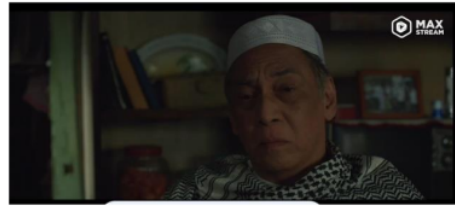
Gambar 2. Nasehat Abah (Kyai fatah) 21:15-:21:23