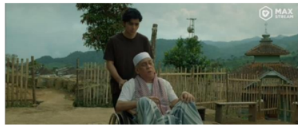
Gambar 7. Percakapan abah dan bahri di depan rumah 44:46-45:13

Segala jenis perilaku manusia yang dapat menimbulkan dosa serta membahayakan diri sendiri dan orang lain (Busthomi, 2023).