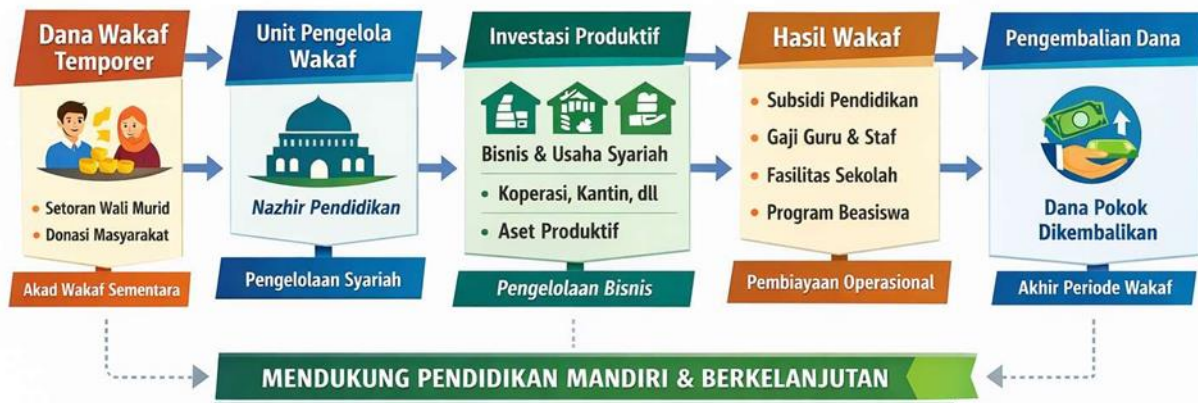
Gambar 2. Perancangan Model Wakaf Produktif Temporal.