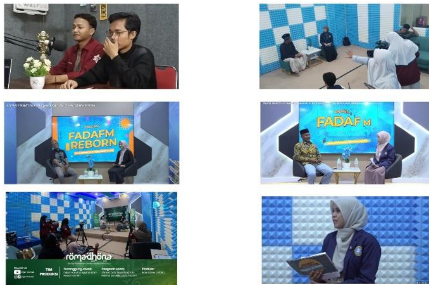
Gambar 4. Model Transformasi Strategi Penyiaran Dakwah Mahasiswa KPI melalui Podcast YouTube (di foto bertahap dari tahun 2024 sampai 2026)

Temuan ini menunjukkan bahwa mahasiswa KPI Universitas Nurul Jadid perlu mengembangkan strategi dakwah yang tidak hanya berorientasi pada penyampaian materi, tetapi juga pada pengalaman komunikasi audiens. Dengan demikian, podcast YouTube dapat menjadi ruang dakwah yang lebih cair, komunikatif, dan sesuai dengan budaya konsumsi media digital generasi muda.