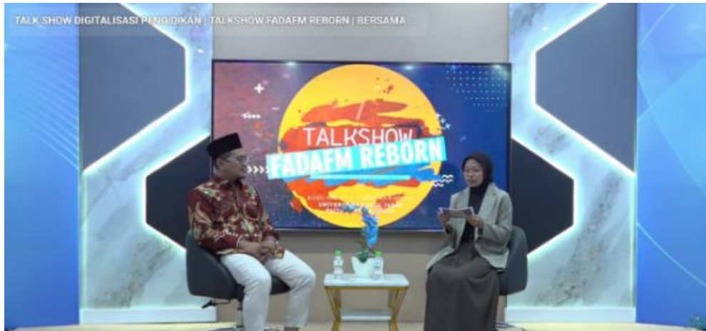
Gambar 3. Dokumentasi Tampilan Podcast YouTube Mahasiswa KPI UNUJA