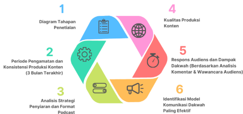
Gambar 1. Diagram Tahapan Penelitian

Sumber data dalam penelitian ini meliputi konten dakwah berbasis YouTube, data statistik sederhana dari platform YouTube, komentar audiens, serta informasi dari kreator atau pengelola konten. Teknik pengumpulan data dilakukan melalui observasi konten, dokumentasi digital, dan wawancara semi-terstruktur (Ruslin et al., 2022). Observasi hanya dijelaskan untuk mengamati tema dakwah, gaya penyampaian, audio-visual, pola komunikasi, narasi, dan interaksi. Dokumentasi dijelaskan untuk mencatat tayangan, suka, komentar, dan keterlibatan audiens. Wawancara dijelaskan untuk menggali proses produksi, tujuan konten, strategi penyiaran, dan kendala.