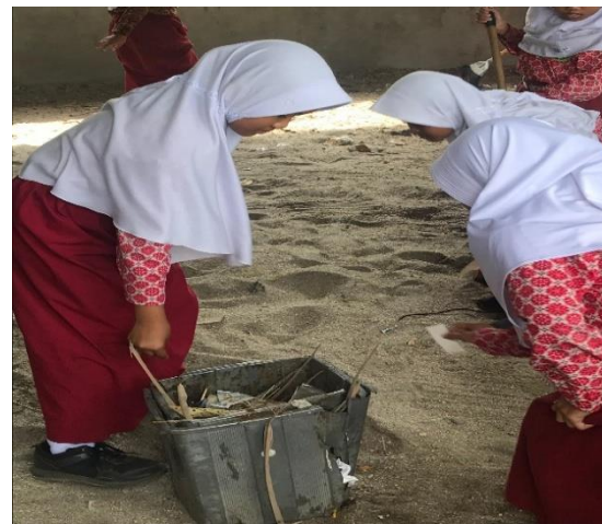
Gambar 2. Kegiatan siswa saat membersihkan lingkungan sekolah.