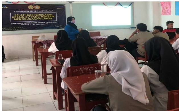
Gambar 1 Pemaparan Materi Oleh Tim PKM

Sesi kedua dilakukan praktik pembuatan CV pada aplikasi Canva yang diikuti oleh para siswa siswi yang sangat antusias. Dan selanjutnya didapatkan beberapa contoh hasil CV yang dikumpulkan peserta yang mengikuti pelatihan. Dari hasil CV yang terkumpul terlihat bahwa peserta memahami isi materi yang telah disampaikan. Peserta mampu membuat CV dengan memperhatikan poin apa saja yang wajib ada di dalam sebuah CV, mengikuti tips membuat CV yang professional dan menggunakan template kreatif yang tersedia di Aplikasi Canva sesuai dengan simulasi pemateri.