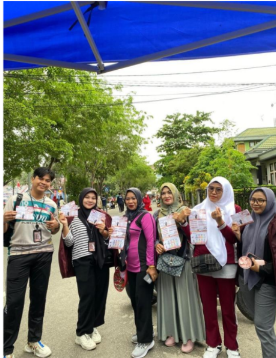
Gambar 3. Foto Bersama Anggota KKN Kelompok 14 dengan Peserta Pemeriksaan