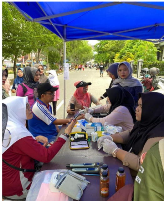
Gambar 2. Pemeriksaan Gula Darah