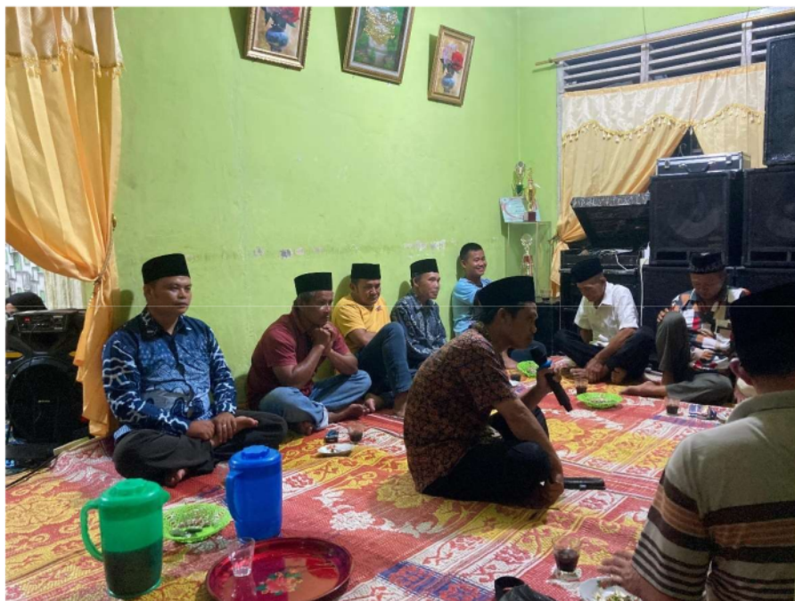
Gambar 8 Musyawarah dengan Warga Masyarakat Desa Muzoi