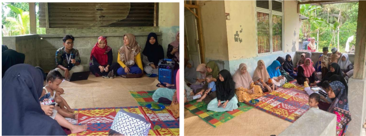
Gambar 6 Pegajian Bulanan PC Nasyiatul Aisyiyah Lahewa Timur