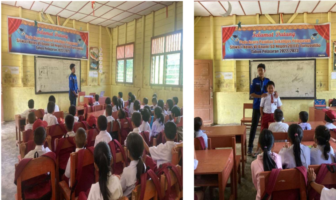
Gambar 7 49 Penyuluhan Perilaku Hidup Bersih dan Sehat di SDN 281115 Turezouliho