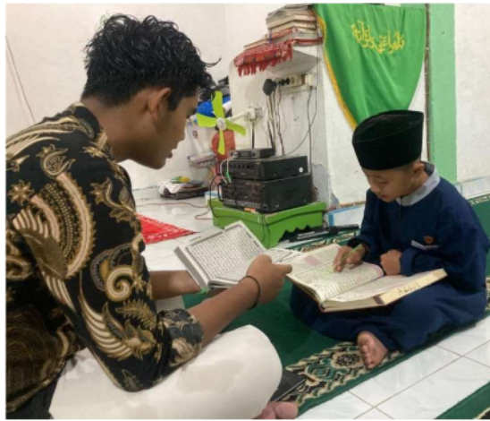
Gambar 9 Kegiatan Maghrib Mengaji di Masjid Taqwa Idanondrawa