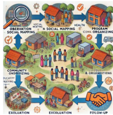
Gambar 4 Diagram Flowchart Proses Perencanaan dan Pelaksanaan Kegiatan Pengabdian Masyarakat di Desa Muzoi

Setelah observasi, dilakukan pertemuan dengan perangkat desa, guru, tokoh masyarakat, dan warga desa untuk membahas rencana kegiatan. Diskusi ini dilakukan dengan metode partisipatif, di mana masyarakat dilibatkan dalam merancang program agar sesuai dengan kebutuhan mereka. Melalui pengorganisasian komunitas ini, masyarakat diajak untuk bersama-sama menentukan prioritas program dan strategi pelaksanaannya.