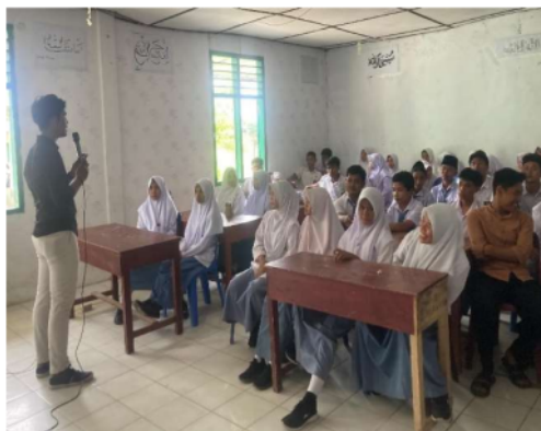
Gambar 11 Penyuluhan Pentingnya Pendidikan Tinggi untuk Pengembangan Karir