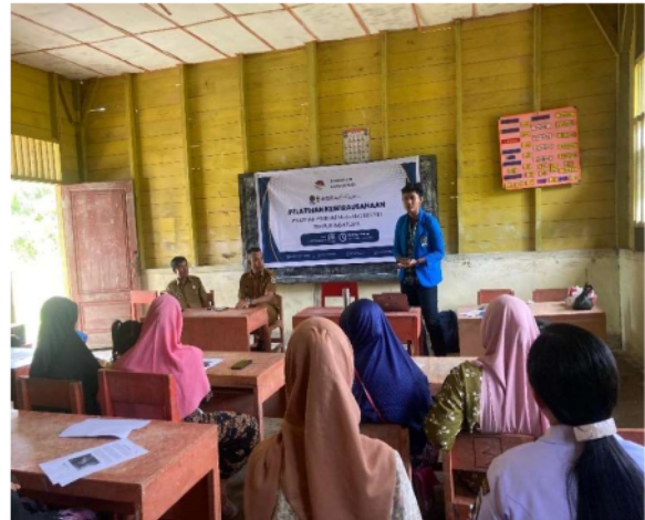
Gambar 10 Pelatihan Kewirausahaan Pembuatan Arang Bricket