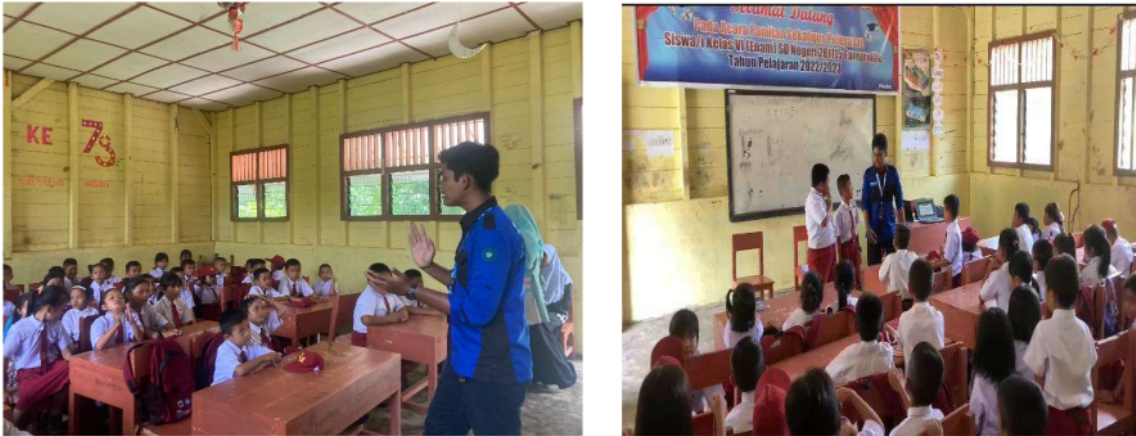
Gambar 5 Kegiatan Belajar Mengajar di SDN 281115 Turezouliho