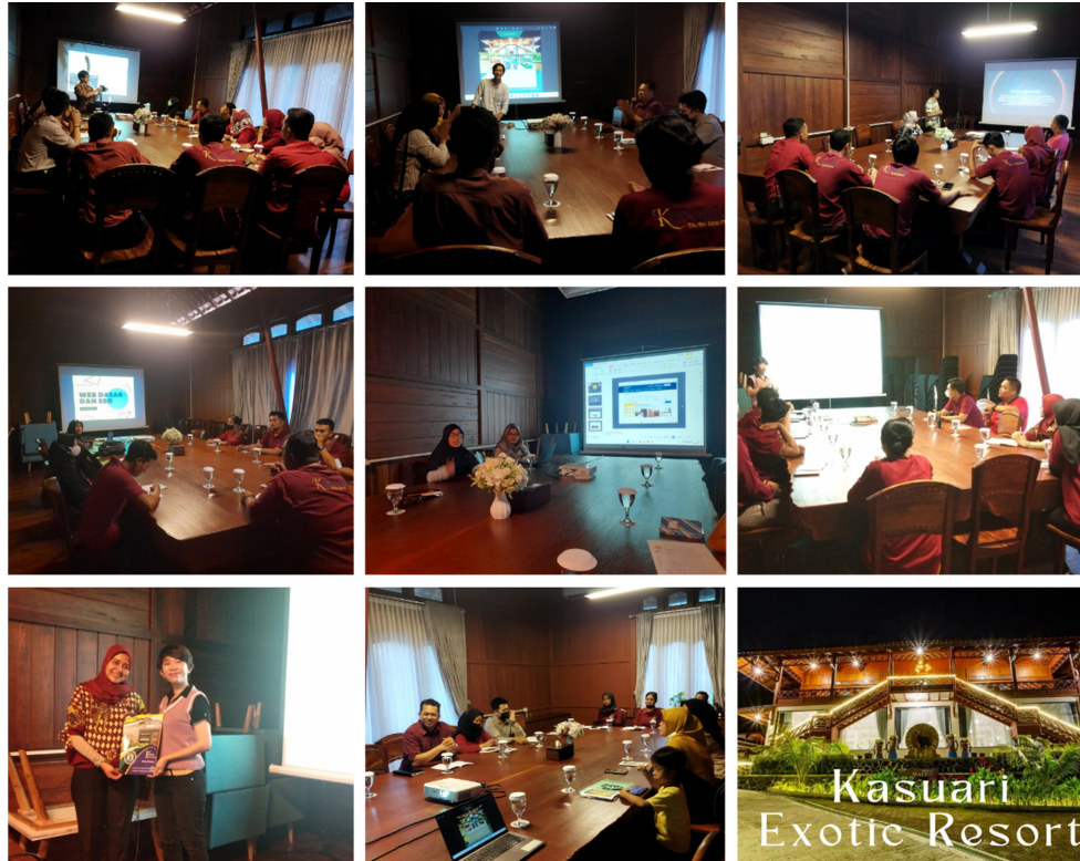
Gambar 5. Dokumentasi Pelaksanaan Kegiatan

Proses pendampingan berjalan dengan pendekatan di mana jika peserta mengalami kendala dalam pengaplikasian materia yang diterima selama pelatihan maka apabila diperlukan dapat sewaktu-waktu meminta pendampingan lanjutan di luar waktu pelatihan dan selama periode Perjanjian Kerjasama masih berjalan.