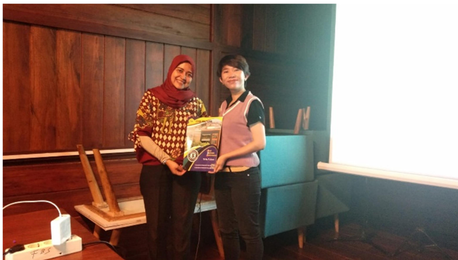
Gambar 4. Penandatanganan Perjanjian Kerjasama

Setelah melalui beberapa kali koordinasi, maka disepakati pelaksanaan penandatanganan Perjanjian Kerjasama. Penandatanganan Perjanjian Kerjasama dilaksanakan di Meeting Room Kasuari Exotic Resort. Poin-Poin pada Perjanjian Kerjasama mencakup hal-hal terkait Tri Dharma termasuk pelaksanaan penelitian, pengabdian, serta penempatan mahasiswa pada program Praktik Kerja Lapangan (PKL).