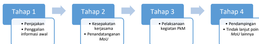
Gambar 3. Kerangka Berpikir PkM di Kasuari Exotic Resort

Tahapan pertama adalah pengumpulan informasi awal di mana tim pengabdian melakukan penjajakan. Sesuai dengan bidang keahlian yang dimiliki maka disepakati akan dilaksanakan pengabdian dalam rangka mendukung peningkatan kapasitas atau capacity building bagi personil di Masuari Exotic Resort. Selanjutnya disepakati untuk melangkah ke tahap kedua yaitu Memorandum of Understanding (MoU) yang salah satunya memuat pelaksanaan PkM yang berlangsung dari bulan November 2022 - Januari 2023.