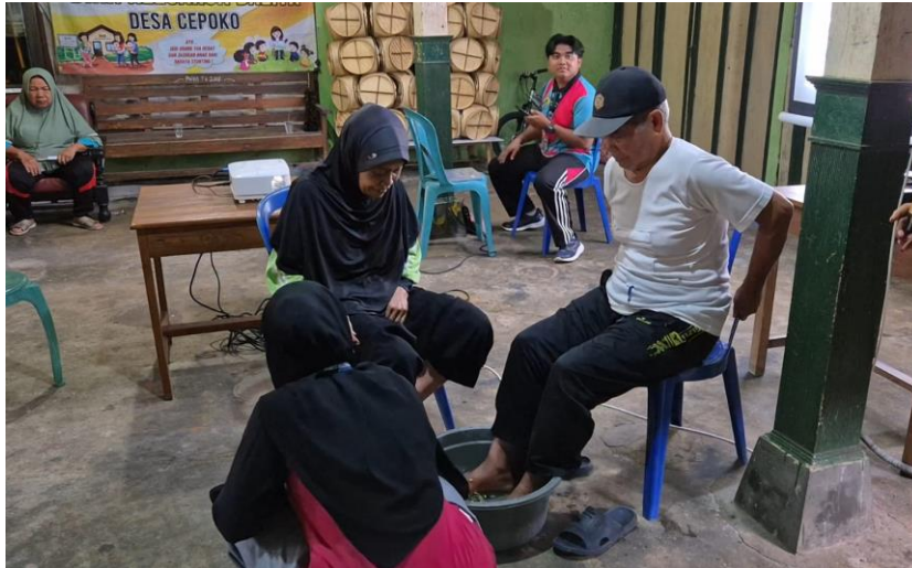
Gambar 4. Implementasi SEHATI.

Pada gambar 2, 3 dan 4 adalah kegiatan penyuluhan program dan demonstrasi SEHATI (Serai Hangat untuk Kaki) di Desa Cepoko Kecamatan Panekan, Kab Magetan Jawa Timur. Kegiatan pengabdian masyarakat melalui demonstrasi SEHATI (Serai Hangat untuk Kaki) menunjukkan hasil yang positif dalam meningkatkan pengetahuan serta membantu menurunkan nyeri sendi pada lansia di Desa Cepoko. Hasil evaluasi menunjukkan bahwa sebanyak 75% peserta mampu memahami, menjelaskan kembali, dan mempraktikkan prosedur pembuatan serta penerapan SEHATI secara mandiri. Temuan ini menunjukkan bahwa metode demonstrasi merupakan strategi edukasi yang efektif dalam meningkatkan pemahaman lansia terhadap terapi komplementer berbasis bahan alam.