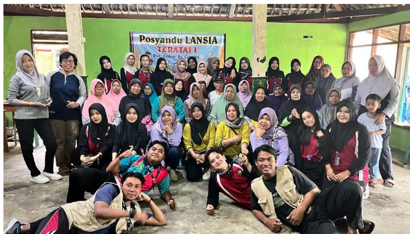
Gambar 3. Foto bersama Peserta Program SEHATI.