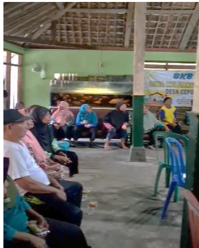
Gambar 2. Penyuluhan SEHATI.