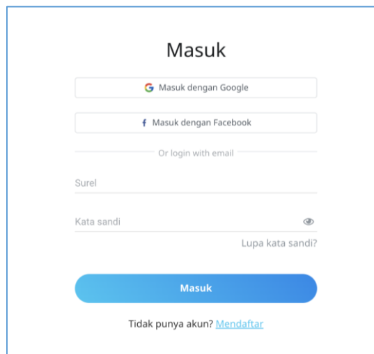
Gambar 4. Halaman login

Kegiatan berikutnya adalah pembuatan website oleh tim dosen dan mahasiswa. Website ini berfungsi untuk membantu Agrotanijaya menyampaikan informasi dan promosi produk olahan porang. Tampilan website diawali dengan halaman login yang diperuntukkan bagi administrator dan pengguna. Adapun tampilan halaman login dapat dilihat pada gambar 4 dibawah ini :