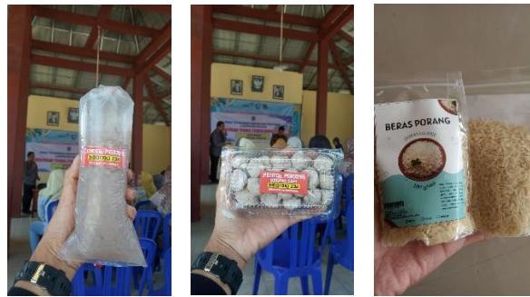
Gambar 1. Produk Olahan Porang Agrotanijaya

Pada penelitian yang dilakukan oleh Indyah dan Indria pada kelompok tani Sapto Gati dimana produk hasil olahan kelompok tani yaitu pupuk organik, bibit tanaman toga dan holtikultura masih dipasarkan secara terbatas. Lingkungan pemasaran hanya pada kalangan masyarakat sekitar seperti saudara, tetangga dan teman. Maka untuk mengatasi masalah tersebut tim peneliti membangun website sebagai sarana promosi. Hasil dari kegiatan ini adalah telah terbangun website yang berisi informasi profil, informasi produk hasil pertanian dan hasil limbah pertanian. Website juga mampu mengelola penjualan online dengan sistem pembayaran transfer 8 . Sebagai gambaran pada penelitian yang dilaksanakan oleh Amrie, dkk dimana permasalahan yang terjadi adalah bahwa Desa Umbulu Kabupaten Jember belum memiliki website desa yang berfungsi sebagai media informasi potensi wisata desa yaitu wisata Watu Pecah. Potensi wisata dapat dimaksimalkan dengan promosi melalui website. Penyampaian informasi wisata menjadi lebih cepat dan jangkauannya lebih luas 9 . Penelitian yang dilaksanakan oleh Wandu dan Sutrisno menunjukkan bahwa proses pembuatan dan pelatihan website profil desa dapat menjadi pengantar bagi pengembangan potensi desa sehingga menaikkan nilai informasi yang dapat memberikan solusi kepada masyarakat 10 .