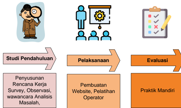
Gambar 2. Tahapan Kegiatan

Program pengabdian Masyarakat ini dilaksanakan pada usaha porang Agrotanijaya dengan merk dagang Indotaki. Lokasi pengabdian adalah Desa Kebondalem, Kecamatan Tegalombo Kabupaten Pacitan. Pelaksanaan kegiatan dilakukan selama 3 bulan (Oktober-Desember 2023) dengan tahapan kegiatan diawali studi pendahuluan, pelaksanaan dan evaluasi. Tahapan kegiatan pengabdian dapat dilihat pada gambar 2 dibawah ini