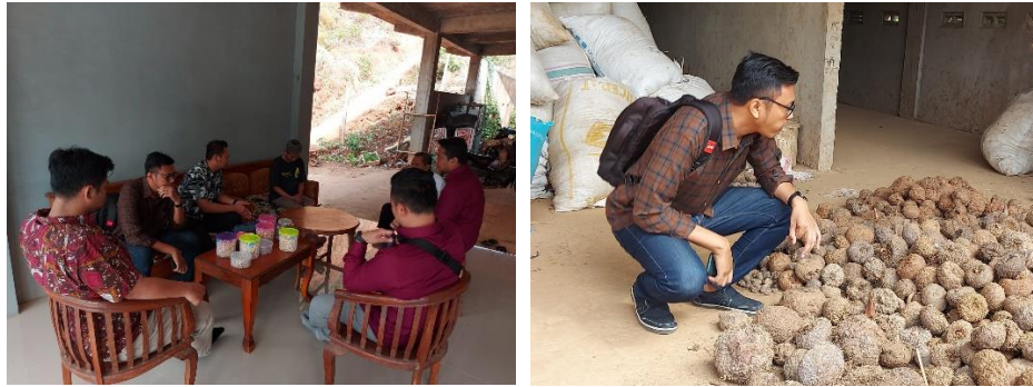
Gambar 3. Survey dan Wawancara

Tahap kedua adalah pelaksanaan diskusi bersama tim pengabdian untuk merumuskan masalah dan membuat rancangan alur website yang akan dibangun. Tim terdiri atas dosen, mahasiswa dan pakar yang memberikan masukan terkait pembuatan website profil. Hasil diskusi menetapkan bahwa website akan memuat informasi profil, produk, lokasi Agrotanijaya dan kontak. Diharapkan informasi yang dimuat dapat membantu Agrotanijaya untuk menyampaikan profile kepada masyarakat luas.