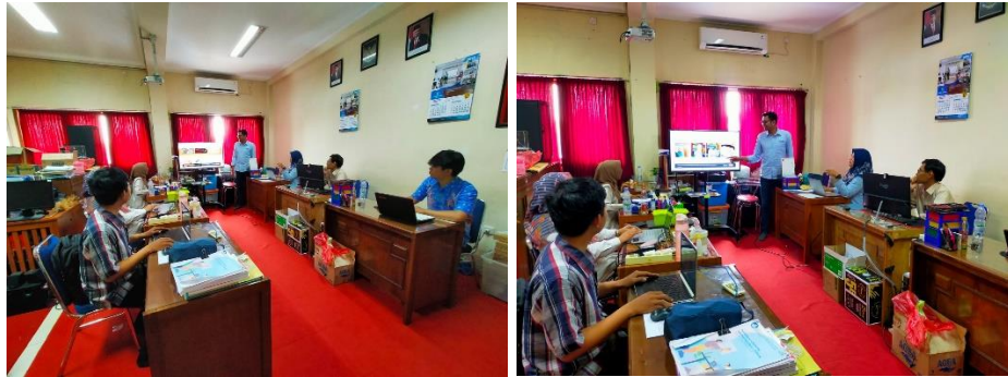
Gambar 7. Kegiatan Pelatihan Website

Tim telah menyelesaikan tahap pelatihan maka tahap berikutnya adalah evaluasi dengan metode para peserta pelatihan melaksanakan praktek mandiri dengan melaksanakan instruksi yang disampaikan pada worksheet yang sudah dibuat oleh tim dosen. Adapun materi evaluasi adalah terkait penggunaan fitur-fitur dalam website. Hasil dari evaluasi yang diikuti oleh 5 peserta dapat dilihat pada tabel 2 dibawah ini